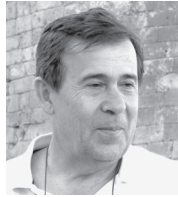
■ Του ΧΑΡΗ ΣΤΡΑΤΙΑΔΑΚΗ*

Επανερχόμαστε σήμερα στο θέμα που μας απασχόλησε την περασμένη εβδομάδα, που είναι και το κατεξοχήν θέμα των ημερών που διανύουμε, τις επιδημίες. Αναφερθήκαμε εκεί στο θέμα των επιδημιών του βιβλίου «Το Ρέθυμνο του Τρόμου», δηλαδή της πανώλης. Κάποιοι αναγνώστες ρώτησαν πού βρέθηκαν όλες αυτές οι πληροφορίες, για ένα τόσο εξειδικευμένο θέμα. Η απάντηση είναι ότι είχαμε ψάξει αρκετά για τις ανάγκες του βιβλίου «Το Ρέθυμνο του Τρόμου» αλλά και ότι οι ιστορικές πηγές είναι ανεξάντλητες, τόσο, που θα μπορούσαν να γραφούν ένα ή και περισσότερα βιβλία με την ιστορία των επιδημιών στην πόλη μας. Σε επίπεδο Κρήτης το έχει ήδη επιχειρήσει ο Θεοχάρης Δετοράκης (εικόνα), με το άρθρο του «Η πανώλης εν Κρήτη: συμβολή εις την ιστορίαν των επιδημιών της νήσου», που αναδημοσιεύτηκε εμπλουτισμένα στα «Βενετοκρατικά Μελετήματα (1971-1994)». Σε κάθε περίπτωση δεν πρέπει να ξεχνάμε τόσο ότι οι επιδημίες είναι κατά βάση ταξικές όσο και ότι η ιστορία τους, όπως και κάθε άλλο γεγονός, είναι επαναλαμβανόμενη.