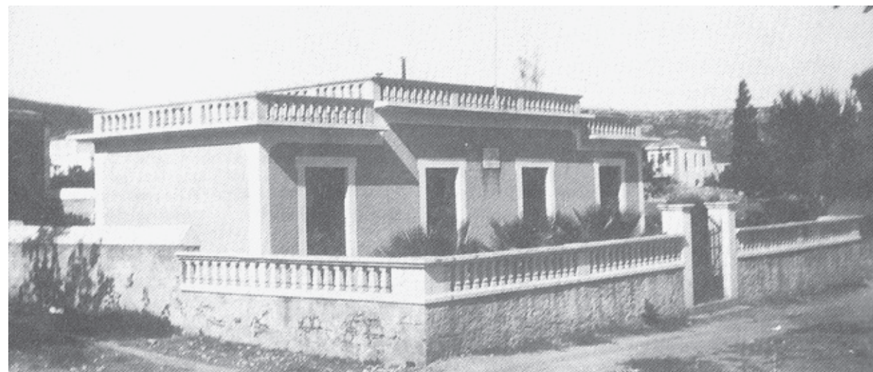
ΤΑΧΥΔΡΟΜΕΙΟ. Στη θέση του οικήματος του σημερινού Ταχυδρομείου είχε οικοδομηθεί γύρω στο 1920, με παρότρυνση του Θεμιστοκλή Μοάτσου, που ονοματοδότησε τον δρόμο, ένας απολυμαντικός κλιβανός, για τον ματισμό των ασθενών που έπασχαν από φυματίωση. Κατά τη δεκαετία του 1950 ο κίνδυνος της φυματίωσης άρχισε να εκλείπει, οπότε το κτήριο πήρε άλλες χρήσεις, στεγάζοντας μεταξύ άλλων τη δημοτική φιλαρμονική και σβήνοντας σταδιακά στη μνήμη των Ρεθιμιωτών ως εγκατάσταση δύσκολων καταστάσεων και στιγμών.