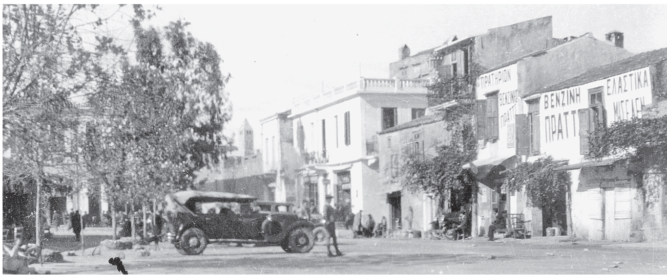
ΠΛΑΤΕΙΑ ΤΕΣΣΑΡΩΝ ΜΑΡΤΥΡΩΝ. Εδώ θα μεταφερθούμε δύο εκατονταετίες πίσω στον χρόνο, στο μέσον μιας από τις μεγαλύτερες επιδημίες, εκείνης των ετών 1817-1839. Ήταν ουσιαστικά την περίοδο της επανάστασης του 1821, όταν η περικλειστή στα τείχη της πόλη αργοπέθαινε από πανώλη, που στο συγκεκριμένο σημείο, έξω από αυτά, αποκεφαλίστηκαν τέσσερις κρυπτοχριστιανοί. Τον ίδιο χώρο της μεταγενέστερης πλατείας χρησιμοποιούσαν παραδοσιακά τον 20ό αιώνα τα πρακτορεία συγκοινωνιών προς τα Χανιά και το Ηράκλειο, τα οποία ανέστειλαν τις εργασίες τους το έτος 1920, όταν η πόλη μπήκε σε καραντίνα, εξαιτίας των κρουσμάτων πανώλης που είχαν αναφανεί. Ήταν η τελευταία τέτοια επιδημία που έθιξε το Ρέθυμνο.