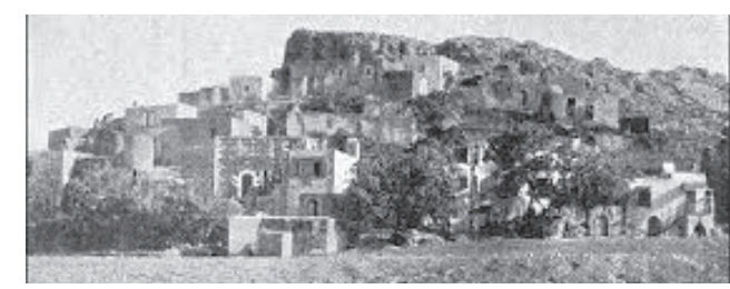
ΤΙΜΙΟΣ ΣΤΑΥΡΟΣ ΚΑΙ ΜΕΣΚΗΝΟΒΡΥΣΗ. Βγαίνοντας από τη νότια είσοδο του ενοριακού νεκροταφείου βρισκόμαστε στις υπώρειες του λόφου του Τιμίου Σταυρού, στον οποίο από τον 18ο αιώνα είχε αναπτυχθεί η συνοικία των πασχόντων από λέπρα, η γνωστή μας Μεσκηνιά ή Λωβοχώρι. Στις σπηλιές και στα καταλύματα διαβίωσαν και απλοί τρωγολύπτες, ενώ όλοι τους υδρεύονταν από τη γνωστή ως Μεσκηνοβρύση, που σήμερα βρίσκεται εντοιχισμένη στη βορειοδυτική γωνία του Δημοτικού Κήπου.

ΑΓΙΟΣ ΝΙΚΟΛΑΟΣ. Στη θέση του σημερινού ναού του Αγίου Νικολάου, που οικοδομήθηκε το 1930, υπήρχε επί ενετικής κατοχής το μοναστήρι του Αγίου Λαζάρου, το οποίο χρησιμοποιούνταν ως το κυρίως λοιμοκαθατήριο της πόλης. Κάπου ανατολικότερα θα πρέπει να λειτουργούσε ένα ακόμη μοναστήρι, λατινικού δόγματος, η Παναγία των Ερημιτιανών Πατέρων, που αναφέρεται στα κατάστιχα δύο νοταρίων (συμβολαιογράφων) του Ρεθύμνου. Το μοναστήρι αυτό λειτουργούσε