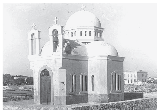
παράλληλα ως ίδρυμα περιθαλής ορφανών παιδιών (Hospitale de la Pietà), και, σε περιπτώσεις αυξημένης ανάγκης απομόνωσης, ως λοιμοκαθατήριο.

ΑΓΙΟΣ ΝΙΚΟΛΑΟΣ. Στη θέση του σημερινού ναού του Αγίου Νικολάου, που οικοδομήθηκε το 1930, υπήρχε επί ενετικής κατοχής το μοναστήρι του Αγίου Λαζάρου, το οποίο χρησιμοποιούνταν ως το κυρίως λοιμοκαθατήριο της πόλης. Κάπου ανατολικότερα θα πρέπει να λειτουργούσε ένα ακόμη μοναστήρι, λατινικού δόγματος, η Παναγία των Ερημιτιανών Πατέρων, που αναφέρεται στα κατάστιχα δύο νοταρίων (συμβολαιογράφων) του Ρεθύμνου. Το μοναστήρι αυτό λειτουργούσε