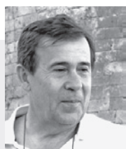
■ Του ΧΑΡΗ ΣΤΡΑΤΙΑΔΑΚΗ

Πραγματοποιήθηκε την περασμένη Τρίτη η δίκη του δολοφόνου της αμερικανίδας βιολόγου Suzanne Eaton, που είχε τελεστεί τον Ιούλιο του περασμένου έτους στην περιοχή του Κολυμπαρίου Χανίων. Η αναζήτηση του πτώματος επί μία σχεδόν εβδομάδα είχε τότε συνταράξει την Κρήτη. Έγινε σε μια περιοχή στην οποία όλοι υποψιάζονταν τον αυτουργό του εγκλήματος, όμως κανένας δεν άνοιγε το στόμα του, είτε από φόβο είτε εξαιτίας μιας περίεργης ομερτα, που επικρατεί όχι μόνο στην Κίσαμο αλλά και σε άλλα μέρη του νησιού μας. Αρκεί να αναλογιστούμε ότι όλοι μύριζαν επί μία εβδομάδα μυρωδιά «μπριτζόλας» σε χωριό του Ρεθύμνου αλλά κανένας δεν το κατέθεσε στη δίκη για τον δολοφόνο της Βουλγάρας εργαζομένης, της οποίας το πτώμα δεν βρέθηκε ποτέ.