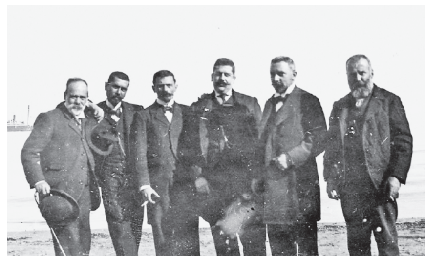
Δε βγήκανε στο μείντανι να επιδειχτούν, μήδε τοιμάσανε ξεπιπούτου την τόση βγενειά. Τους δούλεψε ο καιρός, η αρχοντιά τους ομόρφηνε... Ποια ρηγόπουλα, αναθρεμμένα σε ποια παλάτια, κρατούν με τόση πρεπιά το κεφάλι τους; (Χρονικό 1938, 195)