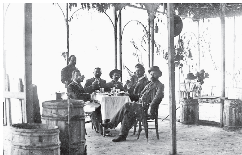
Λεν ακόμα, πράμα που μπορείς να το βεβαιώσεις και σήμερα, πως οι πολίτες του Ρεθέμνου ήτανε πάντα αγαθοί, σεμνοί και συνάμη περήφανοι, διαβασμένοι και κα- λότροποι, μ' ένα λόγο από το είδος εκείνο το σπάνιο στην ανήσυχη Ελλάδα και στην άλλη την Κρήτη ακόμα. (Χρονικό 1938, 8)

Να μην τα πολυλογώ, σ' ένα-δυο χρόνια το κοι- μητήρι είχε γίνει περι- βόλι, η κάθε ρίζα βρήκε κι απόνα κάφκαλο να το βυζάζει, τα δέντρα τρανέψανε, πετάσανε μάτια κι ανθούς, φυλ- λώσανε και φουρφου- ρίσανε τον αέρα. Νί- κησε η ζωή το θάνατο, ασημοκάπνισε το φεγ- γάρι τη μαυρίλα της νύ- χτας, γεμίσανε κελα- δισμό οι στράτες του- ρανού... (Χρονικό 1938, 102)