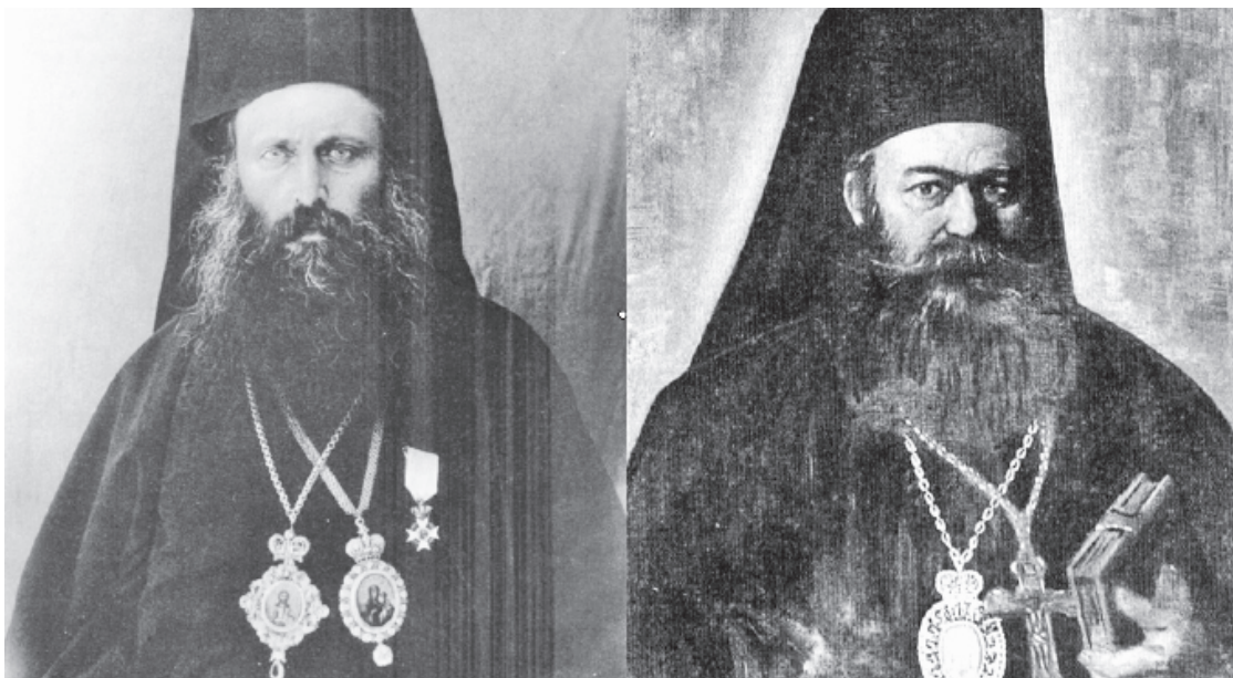
Ζωγράφους πολύ μεγάλους δε γέννησε το Ρέθεμνος... Είταν ο δεσπότης ο Διονύσιος που ζωγράφι- σε το θόλο στην Αγία Βαρβάρα... Πρι ανεβεί στη σκαλωσιά να ζω- γραφίσει στο θόλο της Αγίας Βαρ- βάρας τον Παντοκράτορα, νηστε- ψε δυο εβδομάδες. (Χρονικό 1938, 169-175)

Λογοτεχνικός περίπατος στον τόπο και στον χρόνο της μικρής και συμμαζεμένης πολιτείας (μέρος VIII και τελευταίο)