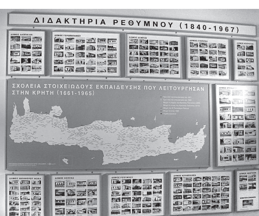
εκπαιδευτική του Πινακίδα, μετά από εκείνες του Σχολικού Χάρτη της Κρήτης με τα 1200 σχολεία, των κατά καιρούς 220 διδασκαστηρίων του Νομού Ρεθύμνης και του Χρονολογίου της Ελληνικής Εκπαίδευσης με τις 180 χρονολογικές εγγραφές.