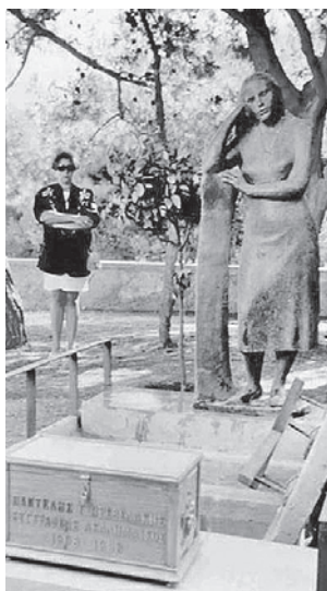
Πέντε χρόνια μετά τον θάνατό του, στις 25 Οκτωβρίου 1991 τα οστά του μεταφέρθηκαν και τάφηκαν στην πατρώα γη, στον λόφο του Εβλιγιά, στα πλαίσια του Ζ' Κρητολογικού Συνεδρίου, κάτω από τη «Σκεπτόμενη Κόρη».