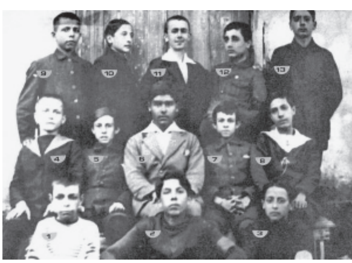
Ήταν ένα ενεργητικό παιδί, τόσο στα γράμματα όσο και στον αθλητισμό. Συμμετείχε επί σειρά ετών στην ποδοσφαιρική ομάδα του Γυμνασίου Αρρέ-