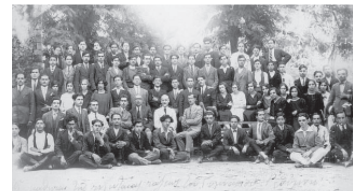
Συνέχισε τις σπουδές του στο Γυμνάσιο Αρρένων, που τότε στεγαζόταν ανατολικά του μητροπολιτικού ναού των Εισοδίων της Θεοτόκου, και αποφοίτη-