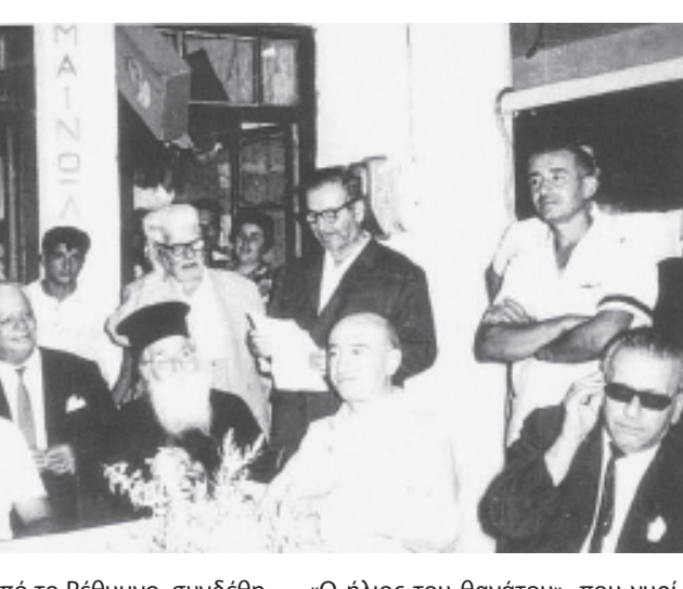
Εκτός από το Ρέθυμνο, συνδέθηκε ιδιαίτερα και με το χωριό Πηγή, όπου φιλοξενούνταν συχνά στο σπίτι της αδερφής του πατέρα του. Ήταν η «Θεία-Ρουσάκη» του μεταγενέστερου μυθιστορημάτος του