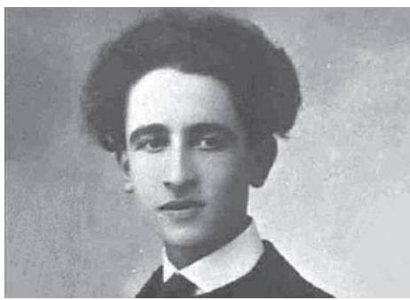
Ξεκινούμε μ' ένα σύντομο φωτογραφικό βιογραφικό σημείωμα. Ο Παντελής Πρεβελάκης γεννήθηκε στις 18 Φεβρουαρίου 1909 στο Ρέθυμνο και πέθανε στην Εκάλη στις 15 Μαρτίου 1986.

τεία του Άγνωστου Στρατιώτη και θα καταλήξει στην αίθουσα εκδηλώσεων του Ιστορικού και Λαογραφικού Μουσείου Ρεθύμνης, που είναι ο συνδιοργανωτής της περιήγησης. Έτσι, με τη βοήθεια της προβολής που θα ακολουθήσει εκεί, θα έχουμε την ευκαιρία, χρησιμοποιώντας ιστορικές φωτογραφίες, και να μεταφερθούμε όχι μόνο στον τόπο αλλά και στον χρόνο συγγραφής της μυθιστορίας, πραγματοποιώντας άλλες ογδόντα περίπου στάσεις. Στα σημειώματα που θα ακολουθήσουν στο «Αναδιφώντας το χθες» θα προσπαθήσουμε να δώσουμε τις κυριότερες από αυτές τις χωροχρονικές στάσεις. Εξυπακούεται ότι, όπως και σε κάθε άλλη ξενάγηση που έχουμε πραγματοποιήσει, η συμμετοχή σ' αυτήν κάθε ενδιαφερόμενου είναι όχι μόνο αποδεκτή αλλά και ευκατά.