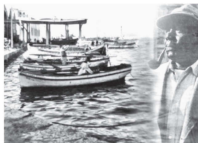
Απ' αυτούς που παραπομείναν ήταν κ' ένα Τουρκάκι, που το λέγανε Μεμέτη κ' ήταν όχι