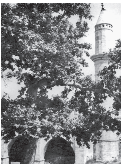
Οι Τουρκορθύμνιοι πρόσφυγες Στην καταστροφή της Σμύρνης, η καρδιά τους βέβαια αναγάλλιασε... μα δεν τόδειξαν σε τίποτα, και τότες που πλακώσαν οι πρόσφυγες και τους πήρανε τα τζαμιά τους να τους κονέψουνε, πάλι δε βγάλαν τσιμουδιά. (Χρονικό 1938, 118)