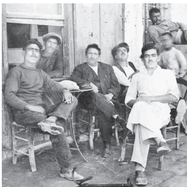
Χαθήκαν ένα-δυο απ' αυτοονούς στα νερά μας, δοκιμαστήκαν από την άγρια θάλασσα, μα στο τέλος τής πήρανε τον αέρα και, με τον καιρό, φέρανε στον τόπο τα δικά τους συνήθια... (Χρονικό 1938, 115)

ταν ήρεμοι άνθρωποι, μαθημένοι θαρρείς να ψαρολογούνε στα ποτάμια κι ασυνείθιστοι στα μεγάλα μπογάζια. (Χρονικό 1938, 115)