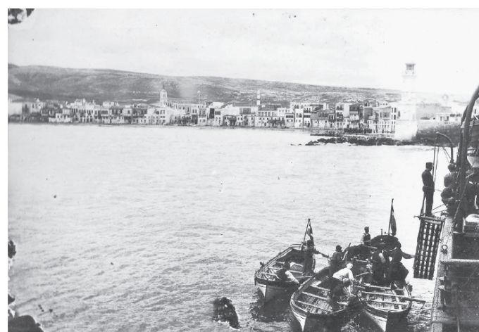
Ζυγώνανε τούτα τα παράξενα θεριά [οι βαπορόβαρκες] το βαπόρι πούστεκε στον ατμό, ο τιμονιέρης έκανε χωνιά τα χέρια του κ' έκραζε τον κάθε επιβάτη με τόνομά του ή με το σουσουμί του, ετούτος πάλι κλειούσε τα μάτια του κ' έπεφτε από το κεφαλόσκαλο στα μπράτσα που τον περιμέναν ανοιχτά από κάτω. (Χρονικό 1938, 142)

νε τρεις ζυγίες στους μπάγκους... έβλεπε μια παράξενη μεταμόρφωση... (Χρονικό 1938, 141-142)