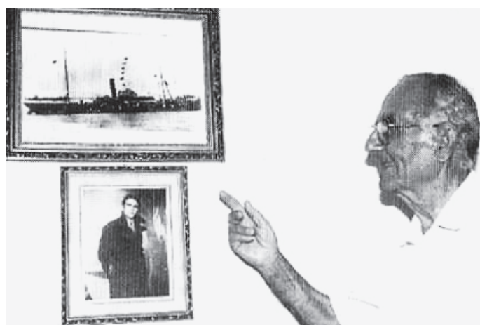
Μπήκανε στις βάρκες, η εξουσία του λιμανιού φόρτωνε τα πράγματά τους με τάξη και τους τάστανε στα βαπόρια, νύχτωσε και ξημέρωσε και κρατούσε ακόμα τού-