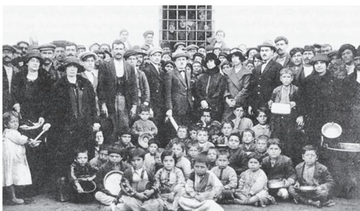
Οι πρόσφυγες της Μικρασίας...ώσπου ήρθαν οι πρόσφυγες με την καταστροφή της Σμύρνης. Σαν ψαράδες, ετούτοι οι ξενομερίτες εί-

Λογοτεχνικός περίπατος στον τόπο και στον χρόνο της μικρής και συμμαζεμένης πολιτείας (μέρος VI)