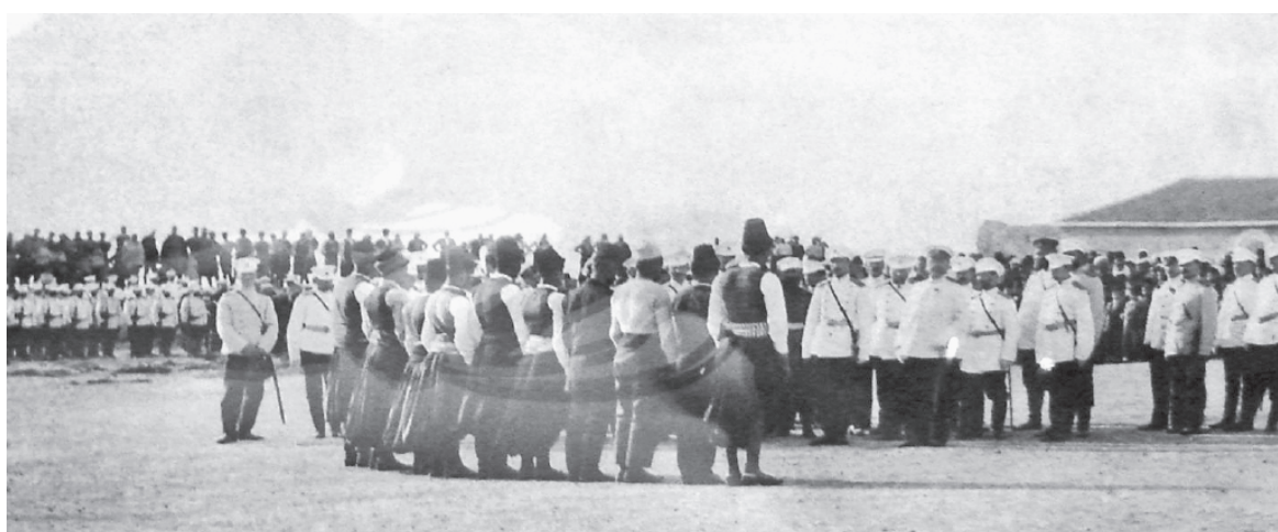
...κανένας δε στεναχωρήθηκε για την αλλαγή. Σ' ένα μονάχα μέρος, στο λιμάνι, το νιώσαν όλοι πως λείψαν οι Τούρκοι και πολλές φορές

τους αναζητήσανε... Στη ναυτωσύνη κανένας ποτέ δεν μπόρεσε να τους παραβγεί... Όταν σε ώρα τρικυμιάς καθίζα-