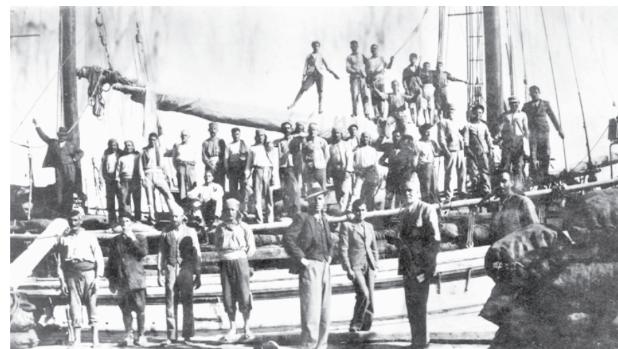
...κι ορδινιάσανε δικά τους σύνεργα ψαρικής, σαν εκείνα που σέρνονται στον Τσεσμέ να πούμε ή στο Αιβαλί. (Χρονικό 1938, 115)