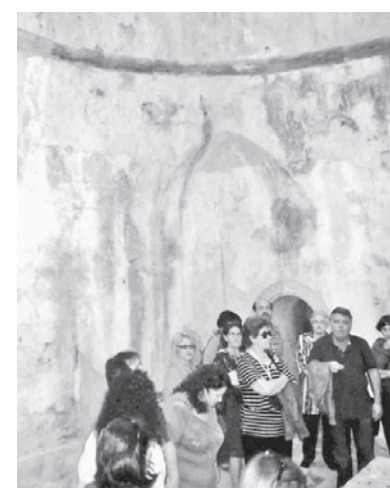
Από τους παραπομεινάρηδες είτανε κ' η λουτραρίσσια από το τούρκικο χαμάμι, που αυτής αλήθεια η ιστορία δε μοιάζει με κανενός άλλου. (Χρονικό 1938, 129-130)