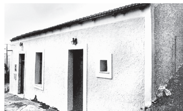
Κοινοτικό διδακτήριο Σχολείου Αποδούλου (1901)