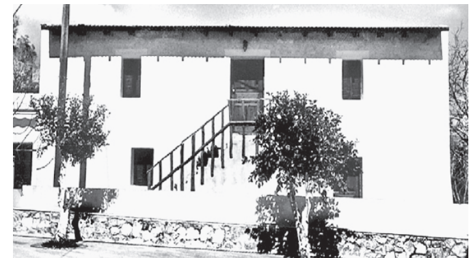
Εκκλησιαστικό διδακτήριο Σχολείου Κοζαρές (διοκτησία Μονής Πρέβηλη, προ του 1900, σήμερα εντελώς τροποποιημένο)