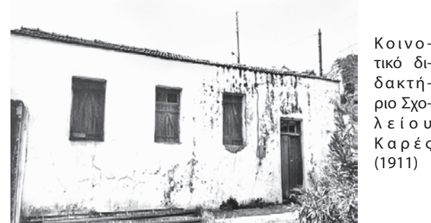
Κοινοτικό διδακτήριο Σχολείου Καρές (1911)