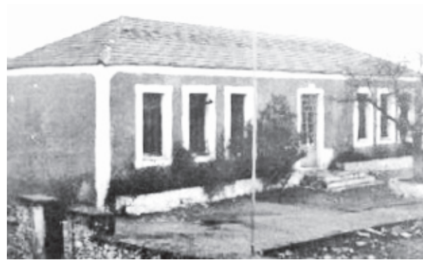
Πρώτη αίθουσα κοινοτικού διδακτηρίου Μέρωνα (1899, με μετατροπή και προσθήκη δεύτερης αίθουσας το 1930)