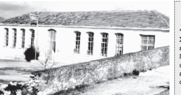
Κοινοτικό διδακτήριο Σχολείου Νίθουρης (1911-1923)