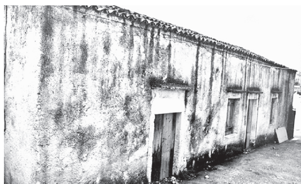
Κοινοτικό διδακτήριο Σχολείου Βισταγής (1900)