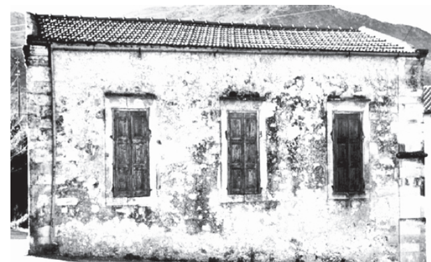
Κοινοτικό διδακτήριο Σχολείου Χρωμοναστηρίου (1900, σήμερα κοινοτικό ιατρείο)