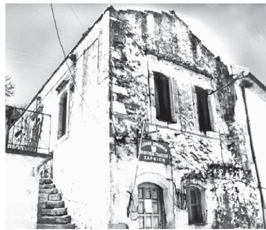
Κοινοτικό διδακτήριο Σχολείου Χαρκίων (1900, μετασκευασμένο το 1923)