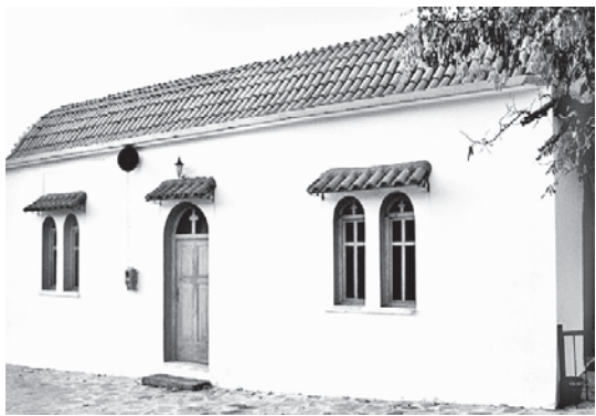
Κοινοτικό διδακτήριο Σχολείου Θρόνου (1899, με μεταγενέστερη μετατροπή σε εκκλησία)