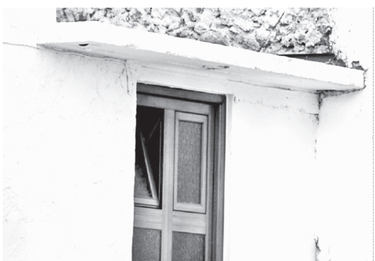
Κοινοτικό διδακτήριο Σχολείου Άνω Μέρους (1900)