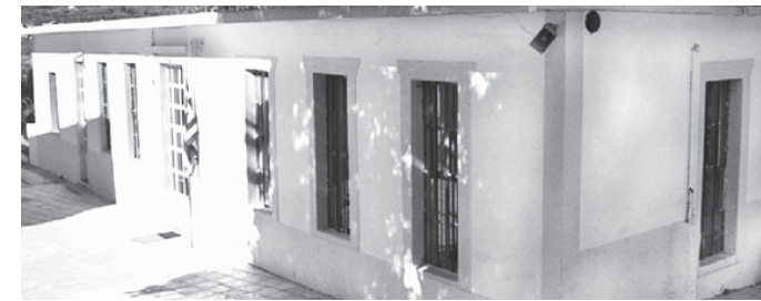
Πρώτη αίθουσα κοινοτικού διδακτηρίου Αρμένων (1881, όπως φαίνεται από την αναμνηστική επιγραφή, ανοικοδομημένο το 1901 και μετασκευασμένο το 1928. Χρησιμοποιείται μέχρι σήμερα ως αίθουσα διδασκαλίας)