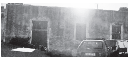
Κοινοτικό διδακτήριο Σχολείου Αρχοντικής (1910)