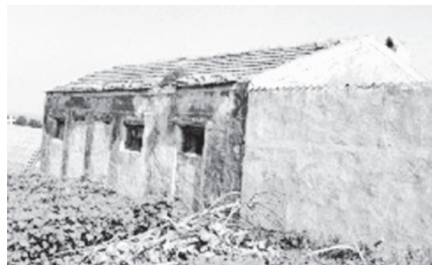
Κοινοτικό διδακτήριο Σχολείου Χαμαλευρίου (1900, με μετασκευή το 1927)