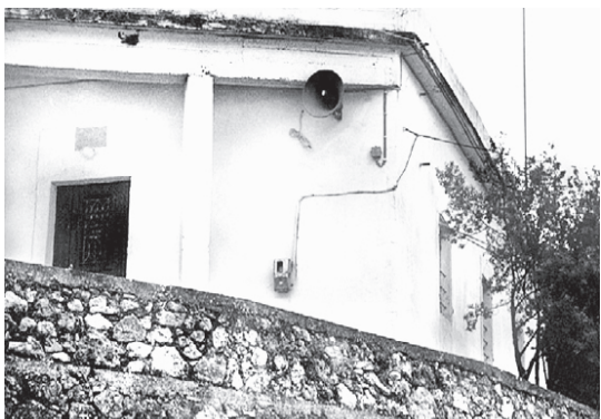
Κοινοτικό διδακτήριο Σχολείου Πλατανίων (1900)