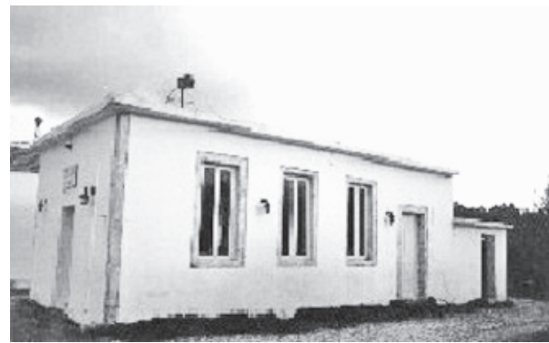
Κοινοτικό διδακτήριο Σχολείου Αγίου Ιωάννη Καμένου (1900, με μετασκευή το 1927, σήμερα αίθουσα εκδηλώσεων Πολιτιστικού Συλλόγου)