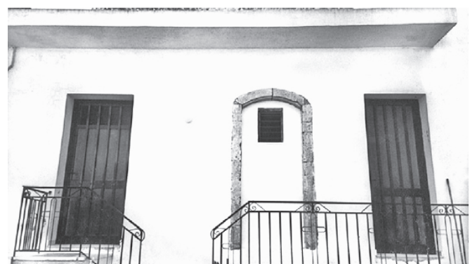
Κοινοτικό διδακτήριο Σχολείου Καρινών (1901)