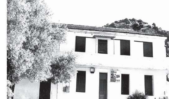
Κοινοτικό διδακτήριο Σχολείου Σπηλίου (1910-1915)