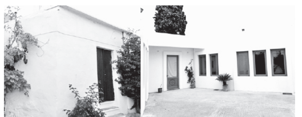
Κοινοτικά διδακτήρια Αρρένων και Θηλέων Μελάμπου (1910, σήμερα εντελώς τροποποιημένα)