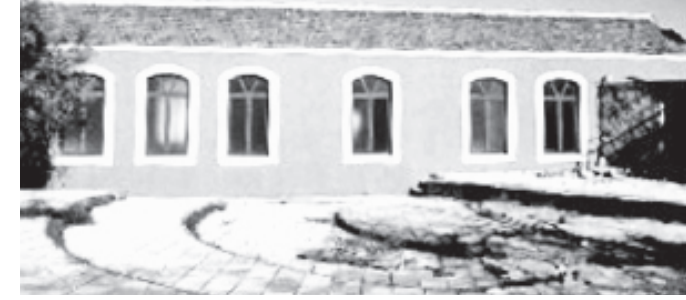
Κοινοτικό διδακτήριο Σχολείου Μουρνές (1882, δύο φορές πυρπολημένο, ανακατασκευασμένο το 1899, μετασκευασμένο την περίοδο 1927-29, σήμερα πρότυπα αναστηλωμένο)

με όμως και άλλα -αναστηλωμένα- διδακτήρια, που αποτελούν κοσμήματα για τα χωριά τους και καύχημα για τους πολιτιστικούς συλλόγους που τα λειτουργούν ως χώρους πολιτισμού, και σε ορισμένες περιπτώσεις ως χώρους σχολικής μνήμης, με την αναπαράσταση αίθουσών διδασκαλίας όπως ακριβώς ήταν πριν σταματήσουν να λειτουργούν τα σχολεία που στέγαζαν. Όσο για τα διδακτήρια τα οποία χρειάστηκε να εκποιηθούν προκειμένου να εξοικονομηθούν χρήματα για την ανέγερση νεότερων διδακτηρίων, οι σημερινοί ιδιοκτήτες θα πρέπει όχι μόνο να τα συντηρούν αλλά και να διατηρούν την αρχιτεκτονική τους φυσιογνωμία -κατά το δυνατόν. Το παράδειγμα σ' αυτό δίνει ένας Γερμανός φίλος της Κρήτης, στα χέρια του οποίου περιήλθε το παλιότερο διδακτήριο μεγάλου χωριού του Αποκόρωνα και το αναπαλάισε και διαμόρφωσε με απόλυτο σεβασμό στη φυσιογνωμία και στην ιστορία του. Με την ευκαιρία θα παρακαλούσα όσους φορείς έχουν προβεί σε παρόμοια -πολιτισμική- χρήση διδακτηρίων, να το κοινοποιήσουν στην ηλεκτρονική διεύθυνση της στήλης, μαζί με μια χαρακτηριστική φωτογραφία της σημερινής τους κατάστασης.