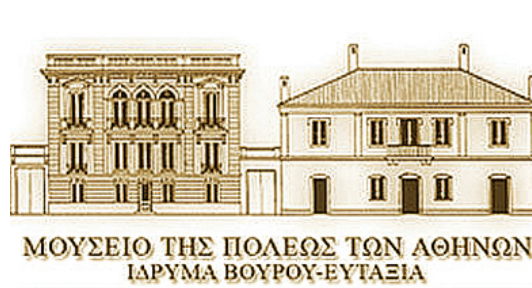
ΜΟΥΣΕΙΟ ΤΗΣ ΠΟΛΕΩΣ ΤΩΝ ΑΘΗΝΩΝ ΙΔΡΥΜΑ ΒΟΥΡΟΥ-ΕΥΤΑΣΙΑ

Ελάχιστες είναι οι ευρωπαϊκές πόλεις, μεγάλες και μικρότερες, που δεν διαθέτουν μουσείο της ιστορίας τους. Ειδικά στη Γαλλία, και η πιο μικρή πόλη, ακόμη και πολλά χωριά, διαθέτουν τέτοιο μουσειακό χώρο και είναι περήφανα γι' αυτόν. Ένα από τα πιο γνωστά είναι το Μουσείο του Λονδίνου . Σ' αυτό προβάλλεται με την ανακαλυπτική μέθοδο η λεγόμενη «μακρά ιστορία της πόλης, από την προϊστορία μέχρι σήμερα». Διαθέτει εκθέσεις σε χρονολογική σειρά, με αυθεντικά έργα τέχνης, μοντέλα, φωτογραφίες και διαγράμματα, με ιδιαίτερη έμφαση σε αρχαιολογικά ευρήματα. Οι εκθέσεις του αναφέρονται επίσης στην αστική ανάπτυξη και στην κοινωνική και πολιτιστική ζωή του Λονδίνου. Άλλα γνωστά ευρωπαϊκά μουσεία ιστορίας είναι αυτά του Άμστερνταμ , της Κοπεγχάγης , της Βιέννης , του Βιτεμπεργκ , του Κέιπ Τάουν , της Ρίγας κ.λπ.