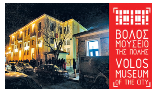
ΒΟΛΟΣ ΜΟΥΣΕΙΟ ΤΗΣ ΠΟΛΗΣ VOLOS MUSEUM OF THE CITY

Και η Αθήνα, παρόλο το μικρό αστικό της ιστορικό βάθος, δεν θα μπορούσε να μην διαθέτει ένα μουσείο της ιστορίας της. Το Μουσείο της Πόλεως των Αθηνών-Ίδρυμα Ευταξία-Βούρου , όπως ονομάζεται από τα επώνυμα των ευεργετών του, στεγάζεται σε δύο ιστορικά κτήρια της πλατείας Κλαυθμώνος και αναφέρεται στην ιστορία της πόλης από τότε που έγινε πρωτεύουσα του ελληνικού κράτους, το 1842. Στο Μουσείο παρουσιάζεται μια μακέτα της πόλης του έτους εκείνου, όπως και χαρακτηριστικά ζωγραφικοί πίνακες, γλυπτά, ιστορικά έπιπλα και άλλα αντικείμενα. Το Ίδρυμα που το υποστηρίζει διοργανώνει επίσης εκδηλώσεις, προσφέρει εκπαιδευτικά προγράμματα και κάνει εκδόσεις, μεταξύ των οποίων και της εφημερίδας με τον τίτλο «Ο Μικρός Ρωμηός».