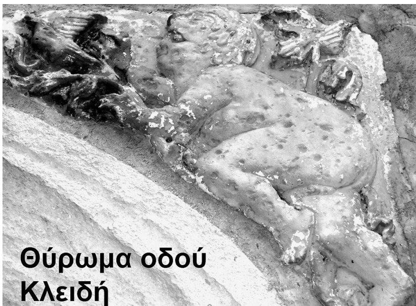
Θύρωμα οδού Κλειδής