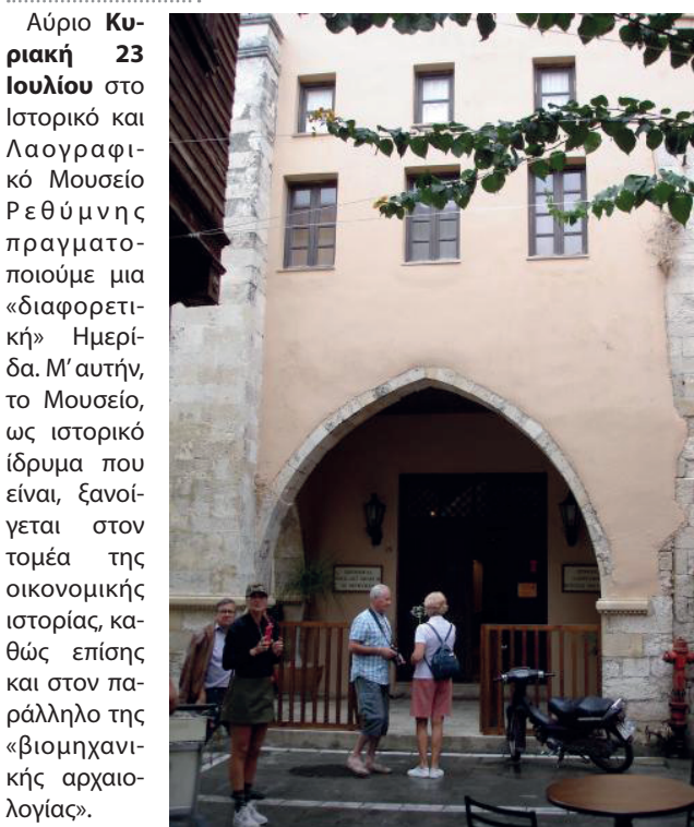
Αύριο Κυριακή 23 Ιουλίου στο Ιστορικό και Λαογραφικό Μουσείο Ρεθύμνου πραγματοποιούμε μια «διαφορετική» Ημερίδα. Μ' αυτήν, ως ιστορικό ίδρυμα που είναι, ξανοίγεται στον τομέα της οικονομικής ιστορίας, καθώς επίσης και στον παράλληλο της «βιομηχανικής αρχαιολογίας».

Στα χρόνια που η σαπυνοποιία κρατούσε όρθια την οικονομία του Ρεθύμνου