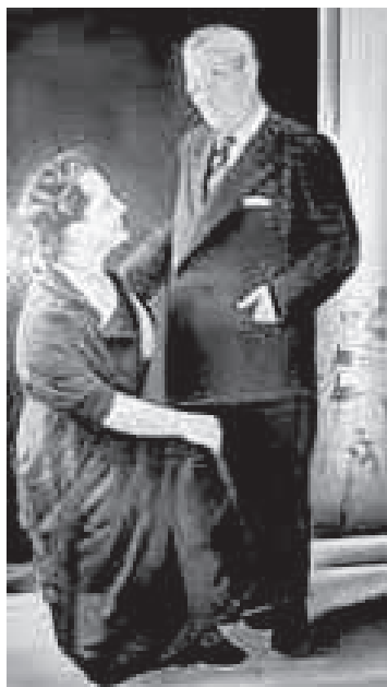
Ομίλου Ρεθύμνης, την οικονομική στήριξη των πρώτων αναστηλωτικών εργασιών στη Μονή Αρκαδίου το 1951 κ.ά.

Είχαμε σταματήσει, λοιπόν, στην προσφορά της Πνευματικής Εστίας και του Πολύβιου Τσάκωνα, η οποία ασφαλώς είναι κατά πολύ ευρύτερη εκείνης της δημιουργίας μιας ευρύτερης Βιβλιοθήκης στην πόλη των γραμμάτων. Ας αναφέρουμε εδώ σήμερα μόνο τη στεγαστική του Αρχαιολογικού Μουσείου στη Λότζια, την ίδρυση του Συλλόγου Διαδόσεως Καλών Τεχνών (Ωδειο), την ίδρυση του Ναυτικού