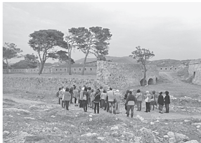
14 Μαΐου: Ξεναγήση στη Φορτέτζα από τις Ι. Στεριώτου και τη Ν. Καραμανλίκη.

Όμως, όπως ένας κούκος δεν φέρνει την άνοιξη, έτσι και μια μέρα παιγνιώδης στις συνολικά 365 δεν φτάνει για να γνωρίσουμε τον τόπο μας. Γι' αυτό και πολλοί απ' όσους ασχολούμαστε με το θέμα προσπαθούμε να σταθεροποιήσουμε και να διευρύνουμε το κοινό των φιλοπόρων με συγγραφές βιβλίων και άρθρων, με εισηγήσεις σε συνέδρια και ημερίδες, με ομιλίες, με προβολές, με ξεναγήσεις και με κάμποσους ακόμα τρόπους. Από αυτούς εξαιρετικά αποτελεσματικός έχει αποδειχτεί ο τελευταίος, των εκπαιδευτικών ξεναγήσεων-περιηγήσεων, στις οποίες το Ρέθυμνο αποδεικνύεται πρωτοποριακό. Αξίζει να αναφέρουμε εδώ ότι μέσα σε μόλις 23 μέρες, από τις 14 του περασμένου Μαΐου μέχρι τις 5 Ιουνίου, πραγματοποιήθηκαν σ' αυτό 13 συνολικά ξεναγήσεις, μερικές από τις οποίες επαναλαμβάνόμενες. Τις διοργάνωσαν δύο κυρίως φορείς, ο Σύλλογος Κατοίκων Παλιάς Πόλης και η Εφορεία Αρχαιοτήτων Ρεθύμνου: