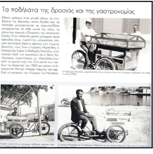
Τα ποδήλατα της δροσιάς και της γαστρονομίας