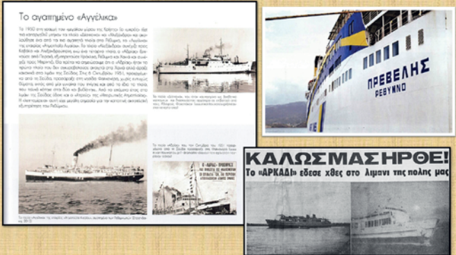
Το αεροπλάνο «Αγέλας»