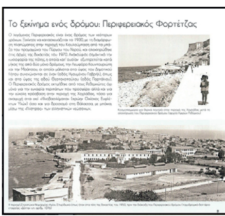
Το ξεκίνημα ενός δρόμου: Περιφερειακός Φορτίτζας