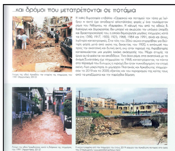
...και δρόμοι που μετατρέπονται σε ποτάμια