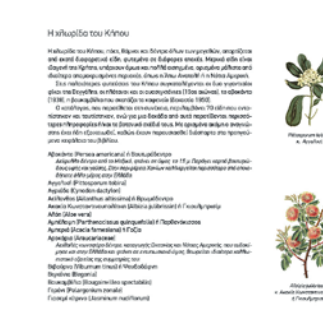
Μαλλοειδές του Κήπου

Το βιβλίο στηρίζεται σ' ένα παλιότερο δικό μου, που το είχα θέσει σε κυκλοφορία το 2017, κλείνοντας την καριέρα μου εκεί ως σχολικός σύμβουλος, με τον τίτλο «Δημοτικός Κήπος, η δροσερή ανάσα των Χανίων. Ιστορία, Χλωρίδα, Πανίδα, Εκπαιδευτικές δραστηριότητες». Η πρώτη εκείνη έκδοση απευθυνόταν κυρίως σε εκπαιδευτικούς και σε γονείς κι είχε ως απώτερο στόχο τόσο την ευαισθητοποίησή τους για την ανάγκη σεβασμού για το μνημείο αυτό της φύσης και του πολιτισμού όσο και τη χρησιμοποίησή του ως εκπαιδευτικού εργαλείου. Έγραφα τότε για την ανάγκη να βγάλουμε τα παιδιά από τις ανθυγιεινές σχολικές αίθουσες, μη περνώντας οπωσδήποτε από το μυαλό μου το τι θα επακολουθούσε με τον Sars 2. Ακόμα όμως και στη συνέχεια, ομολογώ, πολύ λίγοι ήταν οι εκπαιδευτικοί που πήγαν με τα μαθητοΰδια τους σ' έναν ανοιχτό χώρο όπως ο Κήπος για να κάνουν εκεί ένα υγιεινό μάθημα, όχι μόνο στα Χανιά αλλά και στο Ρέθυμνο και σχεδόν παντού στην Ελλάδα. Όπως είχε γράψει παλιότερα ο συμπολίτης Μιχάλης Βαλαρής, με άλλη αφορμή, φαίνεται ότι στην εκπαίδευση χαρακτηριζόμαστε από το «σύνδρομο της πούγκας».