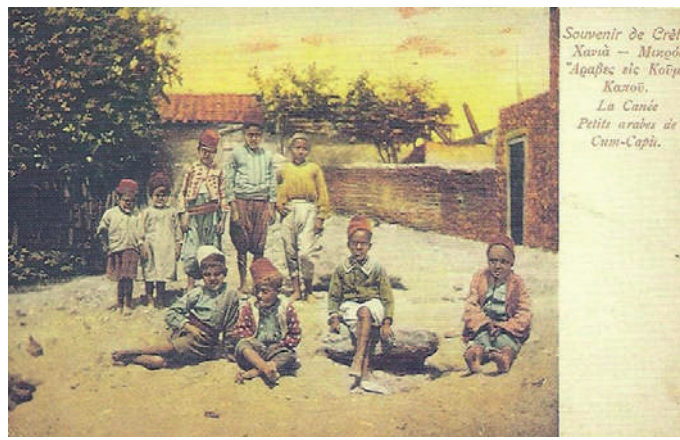
των Χανίων. Εκείνος ο φτωχικός συνοικισμός (στη φωτογραφία από καρτ ποστάλ), με τις κατασκευασμένες από βούρλα καλύβες, μετεξελίχθηκε στη σημερινή συνοικία Κουμ Καπί (> τουρκ. kum kari = πόρτα της άμμου).

Οι σημερινές «Αναδιφήσεις», όπως κι εκείνες της προηγούμενης εβδομάδας, είναι αφιερωμένες στο βιβλίο μου, με τον παραπάνω τίτλο και υπότιτλο, που παρουσιάστηκε χτες βράδυ στον κινηματογράφο του Δημοτικού Κήπου των Χανίων. Είχε τυπωθεί πριν από δύο χρόνια, το 2021, όμως τόσο ο κορονοϊός όσο και τα έργα που πραγματοποιούνταν στον Κήπο δεν επέτρεψαν την παρουσίασή του ωριότερα. Σήμερα παραθέτω δύο ακόμη από τα κεφάλαιά του, τα οποία πιστεύω ότι παρουσιάζουν ενδιαφέρον και για Ρεθεμνιώτες. Επιγράφονται «Η ευρύτερη περιοχή του Κήπου, πριν τον Κήπο» και «Η ευρύτερη περιοχή του Κήπου, μετά τον Κήπο». Στο τέλος προσθέτω μερικά στοιχεία από «Το ιστορικό του Κήπου».