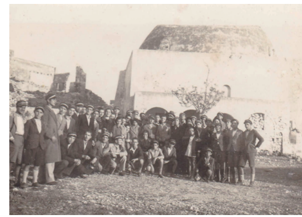
Δεκαετία 1930, εκδρομή γυμνασιόπαιδων στη Φορτέτσα. Όλοι τους φορούν τα πληθιά τους. Μεταξύ τους διακρίνονται και μαθήτριες και δύο τουλάχιστον καθηγητές