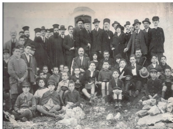
Έτος 1923, εκδρομή δενδροφύτευσης υπό την «Φιλοδασική Ένωση Ρεθύμνης». Οι μαθητές κρατούν στα χέρια τα πληθιά τους και ένας μόνο διαθέτει σκαλίδάκι