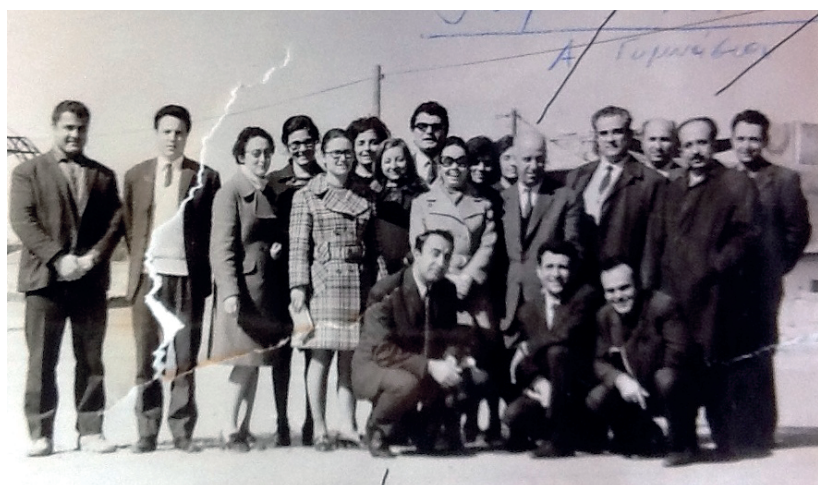
Έτος;;; Οι δασκάλες και νηπιαγωγοί του Ιδιωτικού Σχολείου «Αθηνά» σε μαθητική εκδρομή, σε στιγμές πικ νικ