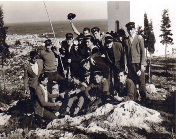
Περίοδος μετά το έτος 1956, εκδρομή γυμνασιόπαιδων στον Άγιο Ιωάννη Πευκακίων. Τα δέντρα πίσω τους δείχνουν νεαρότερη ηλικία. Στο βάθος ο πλωτός γερανός κατασκευάζει το νέο λιμάνι