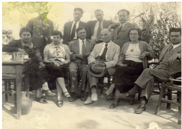
Έτος 1936, καθηγητές και καθηγήτριες του Ρεθύμνου σε μαθητική εκδρομή. Φωτογραφία καλλιτεχνική, πιθανόν του Ε. Ζακάκη