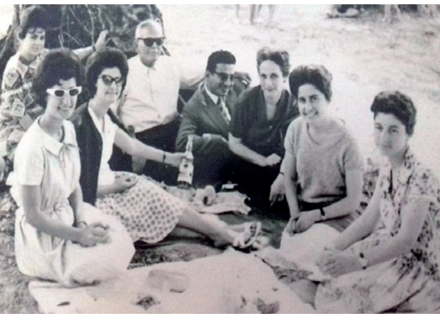
Έτος;; Οι δασκάλες και νηπιαγωγοί και ο ιδιοκτήτης του Ιδιωτικού Σχολείου «Αθηνά» σε μαθητική εκδρομή. Νεανικότητα και φρεσκάδα