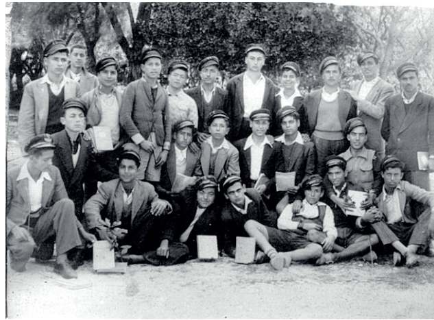
Έτος 1951, εκδρομή γυμνασιόπαιδων της Δ' τάξης στον Δημοτικό Κήπο. Όλοι οι μαθητές φορούν πληθία και ορισμένοι κρατούν βιβλία. Κάποιοι φορούν ακόμα κοντά παντελονάκια