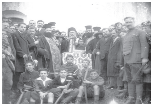
Έτος 1923, εκδρομή δενδροφύτευσης στον Άγιο Ιωάννη. Διακρίνονται οι αρχές της πόλης, με επικεφαλής τον επίσκοπο Τιμόθεο Βενέρη και έξι μαθητές με σκαλίδες. Ο υπομνηματισμός των προσώπων της ιστορικής αυτής φωτογραφίας θα γίνει σε άλλη ευκαιρία