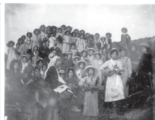
Έτος 1914, εκδρομή του Παρθεναγωγείου Ρεθύμνης στη Φορτέτσα. Όλα τα κορίτσια φορούν καπέλα, μερικά έχουν εμφανές πένθος και ορισμένα κρατούν και παίζουν μουσικά όργανα. Διακρίνονται τέσσερις συνοδοί εκπαιδευτικοί, εκ των οποίων ο ένας είναι άνδρας