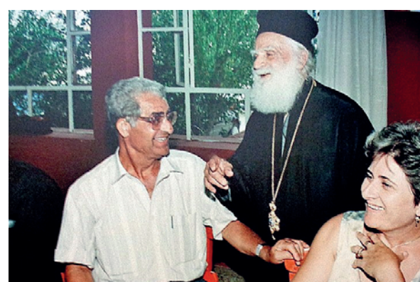
του μέντορά του. Ας είναι ελαφρύ το χώμα που τους σκέπασε και τους δού!