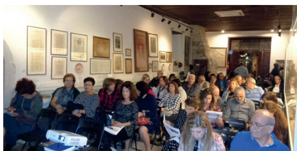
Μποτώνη, αναφερθήκαμε στις δίδυμες κόρες του Παπαδάκου, στους «ξετσιλακωμένους κύκους» του παπα-Γιώργη και στη μαντινάδα με την οποία ξεγέλασαν τον Βασίλη Σκεπετζή οι Ανωγειανοί πελάτες του.

Επιβοηθητικό υλικό. Κρεβετζάκης Θ. - Στρατιδάκης Χ., Οι μετακινήσεις στο Ρέθυμνο. Σημειώσεις συγκοινωνιακής ιστορίας , Ρέθυμνο 2022.