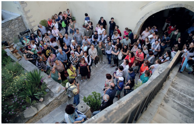
Ξη στο τέλος κατάλληλου βοηθητικού υλικού. Σημειώνω ότι ένα μέρος των ιστορικών περιπάτων μπορεί να προσεγγιστεί αναλυτικότερα μέσω των έντεκα σχετικών βιβλίων που έχω εκδώσει.

Οι «Αναδιφές» ξαναπάνου σήμερα το θέμα των ιστορικών περιπάτων, μετά από τρεις μήνες που τον άφησαν στην άκρη για πιο επειγόντα θέματα, συμπληρώνοντας αισίως με τη σημερινή οκτώ συνέχειες. Πρόκειται για 61 διαφορετικούς περιπάτους που έχω σχεδιάσει και εμπνεύσει για ενήλικες και για 15 εκτελεσμένα και εκτελούμενα μέχρι σήμερα εκπαιδευτικά προγράμματα για παιδιά. Όλα τους έχουν το κοινό χαρακτηριστικό ότι είναι βιωματικά . Η δημοσίευσή τους γίνεται τόσο για να τα θυμηθούμε, όσοι πήραμε μέρος σ' αυτά, όσο και με την ελπίδα ότι θα ωθήσουν και θα βοηθήσουν κάποιους αναγνώστες, εκπαιδευτικούς, φίλους και φυσιολάτρες, στις ίδιες ή σε παρόμοιες δράσεις. Οι αναφορές είναι κατ' ανάγκη περιληπτικές, γι' αυτό και συνοδεύονται από υπόδει-