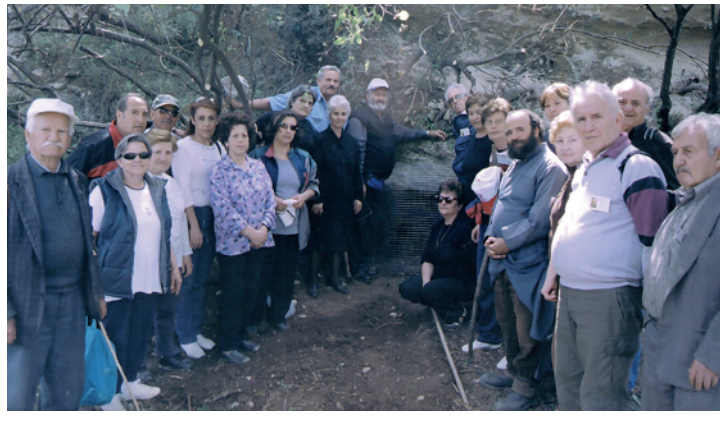
ντι κοίτη τον χωματόδρομο, που κατέστρεψε το αρχαίο κελντερμί, και οδηγούμαστε στον ναίσο της Αγίας Παρασκευής, από τον οποίο και μετά ακολουθούμε το όμορφο κελντερμί μέχρι το χωριό Λαγκά. Ο περίπατος αυτός (φωτογραφία) είχε πραγματοποιηθεί με το Α' ΚΑΠΗ και το ΚΑΠΗ Ανωγειών σε αντίστροφη κατεύθυνση.

Οι «Αναδιφές» ξαναπάνου σήμερα το θέμα των ιστορικών περιπάτων, μετά από τρεις μήνες που τον άφησαν στην άκρη για πιο επειγόντα θέματα, συμπληρώνοντας αισίως με τη σημερινή οκτώ συνέχειες. Πρόκειται για 61 διαφορετικούς περιπάτους που έχω σχεδιάσει και εμπνεύσει για ενήλικες και για 15 εκτελεσμένα και εκτελούμενα μέχρι σήμερα εκπαιδευτικά προγράμματα για παιδιά. Όλα τους έχουν το κοινό χαρακτηριστικό ότι είναι βιωματικά . Η δημοσίευσή τους γίνεται τόσο για να τα θυμηθούμε, όσοι πήραμε μέρος σ' αυτά, όσο και με την ελπίδα ότι θα ωθήσουν και θα βοηθήσουν κάποιους αναγνώστες, εκπαιδευτικούς, φίλους και φυσιολάτρες, στις ίδιες ή σε παρόμοιες δράσεις. Οι αναφορές είναι κατ' ανάγκη περιληπτικές, γι' αυτό και συνοδεύονται από υπόδει-