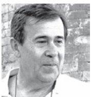
■ Του ΧΑΡΗ ΣΤΡΑΤΙΑΔΑΚΗ*

Οι λίγοι δεν πρέπει να μας κάνουν να πιστέψουμε ότι όλοι βάζουν το δάχτυλο στο μέλι!