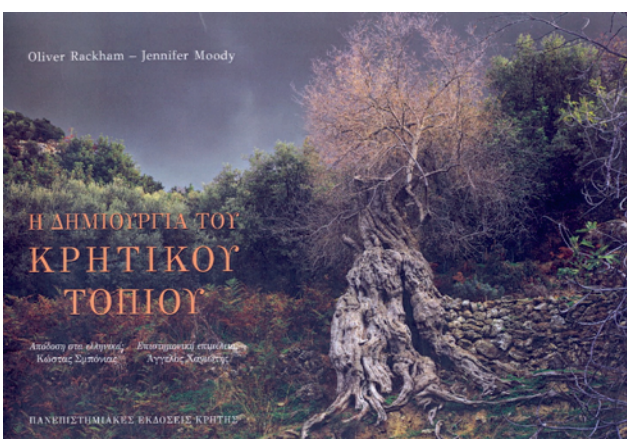
βλίο, στο οποίο να επισημαίνονται και να εξηγούνται οι ιδιαιτερότητες του κρητικού περιβάλλοντος. Βέβαια υπήρχε ένα που θα μπορούσε να θεωρηθεί ότι κάλυπτε επαρκώς το κενό...

Είχαμε τη χαρά να τον έχουμε μαζί μας, μετά συζύγου και τέκνου, σε μια διήμερη εξόρμηση που είχα οργανώσει για εντοπισμό και εξερεύνηση σπηλαίων στη δυτική ακτογραμμή της Κρήτης... «Ο Δήμος βέβαια μετά της οικογενείας, αυτοί σε αντίσκηνο στον κήπο...»