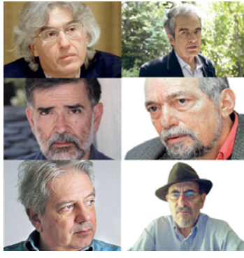
«αλλαγής», αντιλήφθηκε έγκαιρα ότι το επιτέλειο του περιοδικού τον πήγαινε πολύ έξω από τις στοχεύσεις του, γι' αυτό και το έκλεισε κι ας ήταν ευπώλητο...