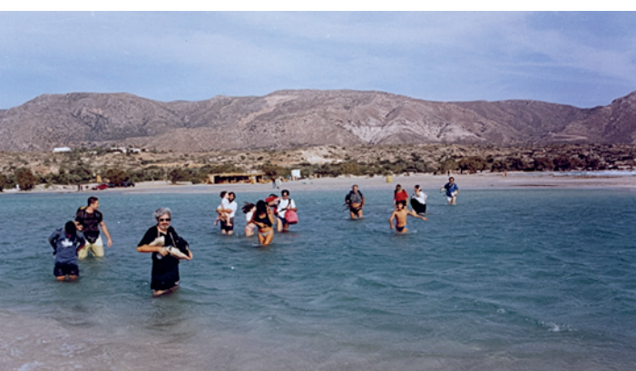
σπήλαια της θυσίας του 1824. Αν αναζητήσουμε το έργο που πρόσφερε στο Ρέθυμνο το λόγο, όπως απολαμβάνουμε και τον προφορικό στις συνεδριάσεις στο Κέντρο Νέων...

Έγραψε γι' αυτόν ο Ηλίας Ευθυμίου: «...Ο Θεός δεν έτρεξε, έτρεξε όμως ο Δήμος. Με το σακίδιο και τη μοτοσυκλέτα. Στον Αχελώο και στις Πρέσπες, στη Δήλο και στη Σαντορίνη, στη Μάνη και στα Κύθηρα...»