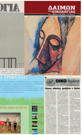
από τους συνεργάτες του στη «Νέα Οικολογία». Ήταν άνθρωπος και της πράξης και της διδασκαλίας, όταν τα κατάφερνε να συγκεντρώνει κόσμο.

Όταν ο Δήμος μάς μιλούσε πριν από δύο και πλέον δεκαετίες για την άνοδο της στάθμης της θάλασσας, για κλιματική αλλαγή, για πλημμύρες, για πυρκαγιές και ερημοποίηση... «Από τους συνεργάτες του στη «Νέα Οικολογία». Ήταν άνθρωπος και της πράξης και της διδασκαλίας, όταν τα κατάφερνε να συγκεντρώνει κόσμο. Και τα κατάφερνε, γιατί είχε το χάρισμα να πείθει, να διαλέγεται, να ακούει.