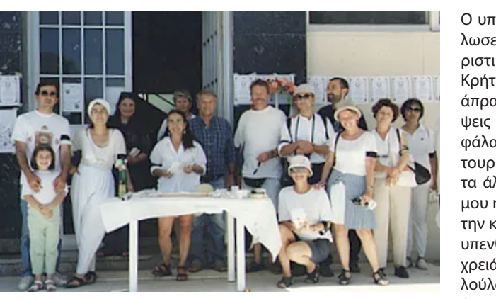
εν ζωή οι γείτονές μας Ηρακλειώτες το 2017. Τα σημάδια της αρρώστιας ήταν ήδη τότε έκδηλα, κι όμως, κατάφεραν να ξεπεράν κάθε τόσο τις αγχώδεις με την κοινή λογική, που πάντα τον διέκρινε. Μόνο όταν πέθανε συνειδητοποιήσαμε ότι είχαμε την τύχη να μένει στον τόπο μας...

Σήμερα συνειδητοποιούμε ακόμα περισσότερο την απουσία του και το χάρισμά του να συνενώσει και να κινητοποιήσει, όταν επικρέμεται η απειλή, στο κέντρο του Ρεθύμνου, στο πιο προνομιμακό για αστικό πράσινο αδόμητο οικόπεδο, στη Σχολή Χωροφυλακής, να ανεγερθεί ένα αστυνομικό μεγαθήριο, αντί να αποδοθεί στους δημότες για αναψυχή και άθληση... «Έβλεπε ότι δεν ήταν λίγος ο κόσμος που αποζητούσε ένα τέτοιο βιβλίο, στο οποίο να συμπεριλαμβάνονται οι έρευνες του δύο δεκαετιών...»