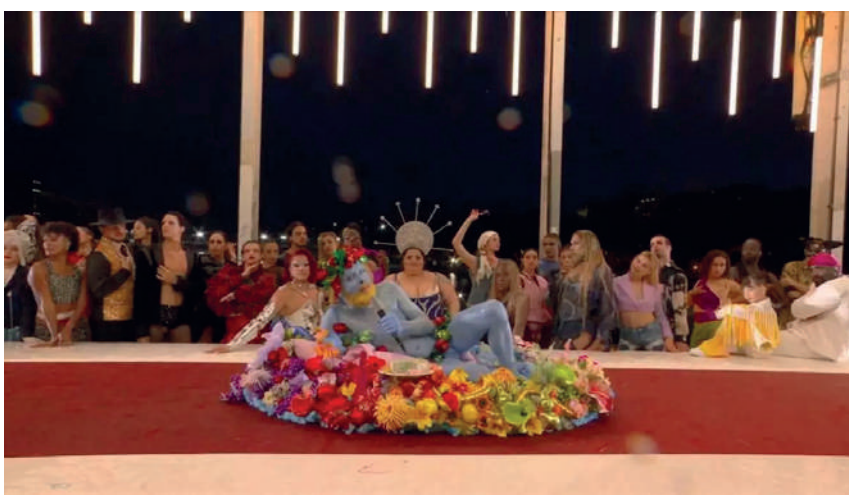
Εκ μέρους όλων των χριστιανών όλων των ηπειρών που έχουν πληγωθεί από αυτές τις σκηνές... κ.λπ. Μαζί της κι ο Ερντογάν, «διαθρησκειακά» εκείνος.