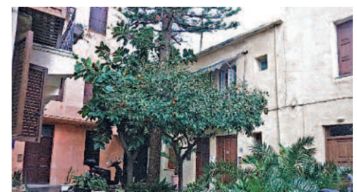
ΣΤΑΣΗ 1 η : ΠΛΑΤΕΙΑ ΗΡΩΩΝ ΠΟΛΥΤΕΧΝΕΙΟΥ (συνέχεια) Βιοκλιματικές πλατείες.

Μια άλλη πραγματικά πράσινη πλατεία είναι η μικροσκοπική που διαμορφώνεται παράπλευρα της οδού Κορνάρου. Πρόκειται για μια από τις ορθογωνικές διευρύνσεις που απαντώνται στην παλιά πόλη, επιτρέποντας στα απέναντι σπίτια να «αναπνεύσουν». Οπωσδήποτε, και στις δύο αυτές πλατείες, οι γείτονες εκτιμούν το πράσινο και το περιποιούνται, διατηρώντας το σε άριστη κατάσταση.