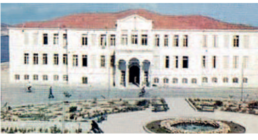
ΣΤΑΣΗ 1 η : ΠΛΑΤΕΙΑ ΗΡΩΩΝ ΠΟΛΥΤΕΧΝΕΙΟΥ (συνέχεια) Αφαίρεση και όχι πρόσθεση πρασίνου

προϋπάρχοντος υψηλού πρασίνου. Παρότι η παρέμβαση στην περιοχή χαρακτηριζόταν «βιοκλιματική», οι νέες φυτεύσεις ήταν ελάχιστες. Κατά τις διαμορφώσεις, δε, του γειτονικού γηπέδου και του νοτιότερου απ' αυτό χώρου στάθμευσης θυσιάστηκαν και μερικά από τα αλμυρικά της περιοχής.