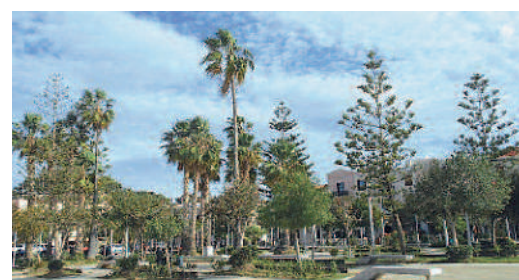
ΣΤΑΣΗ 1 η : ΠΛΑΤΕΙΑ ΗΡΩΩΝ ΠΟΛΥΤΕΧΝΕΙΟΥ (συνέχεια) Βιοκλιματικές πλατείες.

Δεν είναι μόνο η πλατεία της Σοχωράς (στη φωτογραφία η σημερινή κατάσταση του πρασίνου) που διεκδικεί τίτλους, τους οποίους δεν αξίζει. Παλιότερα, η πλατειούλα μπροστά στην κρήνη Rimondi διεκδικούσε εκείνον της Πράσινης Πλατείας, εξαιτίας αποκλειστικά και μόνο των πολιτικών φρονημάτων κάποιων καταστηματαρχών της! Υπάρχουν όμως και πλατείες που δείχνουν έναν «τρίτο δρόμο». Η πλα-τεία 25ης Μαρτίου δημιουργήθηκε τη δεκαετία του 1980 με παραχωρήσεις γης των παρόδιων ιδιοκτητών και διαμορφώθηκε με έξοδα των αποφοίτων των Γυμνασίων αρρένων και θηλέων του σχολικού έτους 1945-46, με πρωτοβουλία του αείμνηστου Μανού Αστρινού.