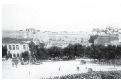
ΣΤΑΣΗ 1 η : ΠΛΑΤΕΙΑ ΗΡΩΩΝ ΠΟΛΥΤΕΧΝΕΙΟΥ