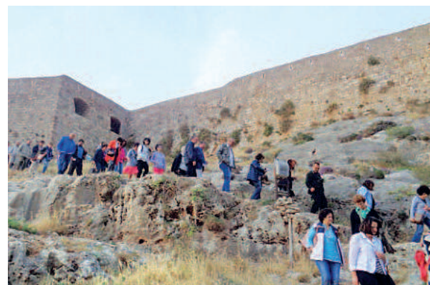
Ο χλωριδικός πλούτος των τειχών της Φορτέτζας (1)