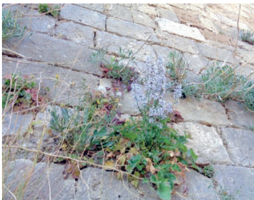
«Δεν άνθησαν mataiwos» στα τείχη... (1)