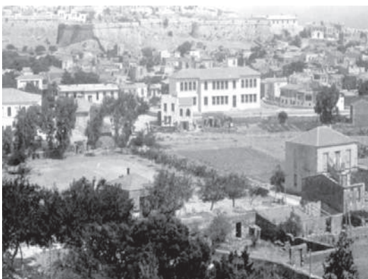
ΣΤΑΣΗ 3 η : ΟΔΟΣ ΜΕΛΙΣΣΙΝΟΥ 11 & 17 (συνέχεια)

Περιβόλια στις σπιανάδες. Κατά τη Βενετοκρατία, το Ρέθυμνο απέκτησε δύο σημαντικές οχυρώσεις, πέραν της αρχικής του Castel Vecchio: την περιμετρική (1540-1570) και αυτήν της Φορτέτζας (1573-1580). Η οχυρωματική τέχνη της εποχής επέβαλε τη διατήρηση ακάλυπτων χώρων μπροστά από αυτές, χώρων που ονομάζονταν σπιανάδες (>ιταλ. sriapane =ισοπεδώνω) και οι οποίοι, επί οθωμανικής κυριαρχίας, άρχισαν να καλλιεργούνται, μετονομαζόμενοι σε περβόλες. Η πρακτική επιβίωσε ως τη σύγχρονη εποχή, οπότε, όσες περβόλες δεν είχαν στο μεταξύ οικοδομηθεί, μετατράπηκαν σε χώρους στάθμευσης αυτοκινήτων.