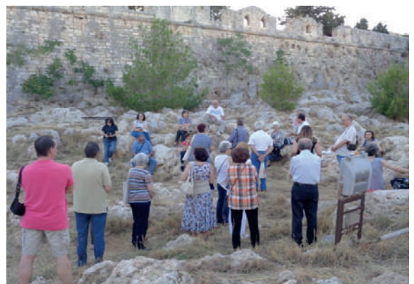
Ο χλωριδικός πλούτος των τειχών της Φορτέτζας (2)

Ακούστηκε σαν πρωταπριλιάτικο αστέιο, όταν ο Σύλλογος Κατοίκων Παλιάς Πόλης ανακοίνωσε ότι διοργανώνει ξεναγήσεις στη χλωρίδα των τειχών της Φορτέτζας. Το αστέιο, όμως, έγινε πραγματικότητα στις 22 Μαΐου 2016, όταν ο συγγραφέας του βιβλίου εμπύχωσε την ξενάγηση «Προμαχόνες και κανονιοθυρίδες, κολισαυρές και πετρομαρουλίδες: περιήγηση στον μνημειακό, χλωριδικό και πανιδικό πλούτο των τειχών της Φορτέτζας».