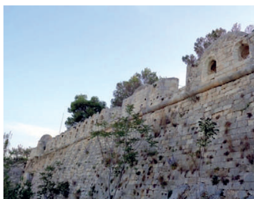
«Δεν άνθησαν mataiwos» στα τείχη... (2)