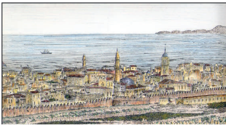
ΣΤΑΣΗ 2 η : ΟΔΟΣ ΜΕΛΙΣΣΙΝΟΥ 11 & 17

Μια άλλη πραγματικά πράσινη πλατεία είναι η μικροσκοπική που διαμορφώνεται παράπλευρα της οδού Κορνάρου. Πρόκειται για μια από τις ορθογωνικές διευρύνσεις που απαντώνται στην παλιά πόλη, επιτρέποντας στα απέναντι σπίτια να «αναπνεύσουν». Οπωσδήποτε, και στις δύο αυτές πλατείες, οι γείτονες εκτιμούν το πράσινο και το περιποιούνται, διατηρώντας το σε άριστη κατάσταση.