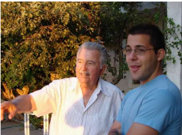
Ψε έναν πλήρη κύκλο ζωής κι έφυγε χωρίς ιδιαίτερες επιπλοκές υγείας. Έφυγε σε μια στιγμή της ζωής του τέτοια, που οι ειδικοί κι οι φίλοι να φέρνουν στη μνήμη τους μόνο καλές στιγμές του, εκείνες που επισφραγίζονταν με το φωτεινό του χαμόγελο.

Άφησε πίσω του τα επίγεια πριν από σαράντα μέρες ένας βέρος Ρεθεμνιώτης. Μπορεί βέβαια να έζησε το μεγαλύτερο μέρος της ζωής του στην Αθήνα, όμως ήταν πάντα στο Ρέθυμνο, είτε με φυσική παρουσία τα καλοκαίρια είτε με την ανάγνωση των εφημερίδων του, με το τηλέφωνο και με τη διατήρηση ισχυρότατων δεσμών με τους Ρεθύμιους της Αττικής. Τον ξεπροβοδίσαμε στη Μεσοαμελίτισσα θλιμμένοι και κατηφείς ασφαλώς αλλά όχι και οδυρόμενοι, αφού διέγραφε