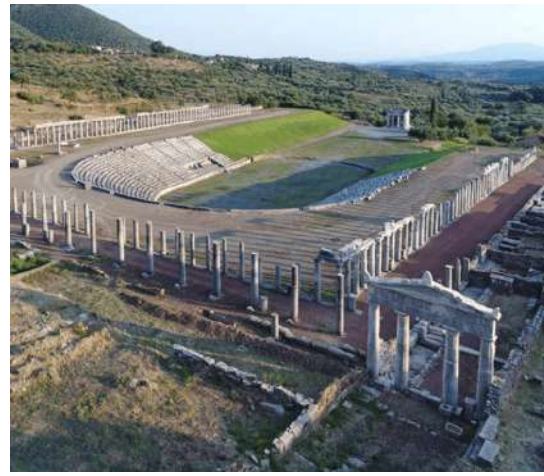
Οι στοές και το στάδιον