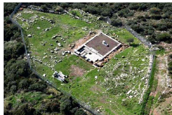
Το ιερό της Αρτέμιδος