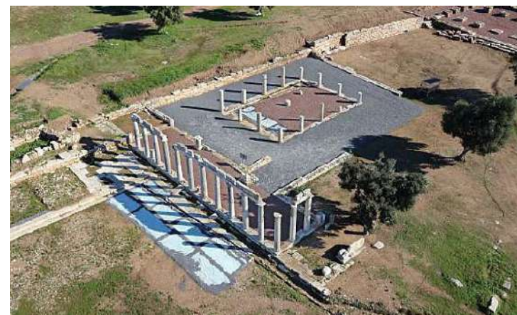
Το κρεπούλιον -θυσιαστήριον