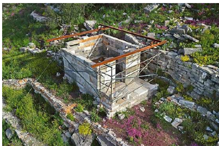
Ο αναστηλωμένος ναός της Ειλυθίας