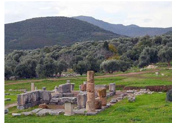
Ο ναός της θεοποιημένης βασίλισσας Μεσσανάς