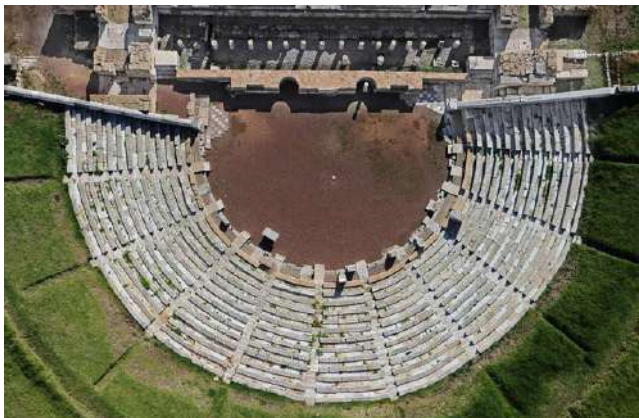
Το αναστηλωμένο θέατρο

Πιστεύω ότι αυτή τη φορά δεν θα μας αφήσει να πλήξουμε το ίδιο το θέμα της διάλεξης, ο καθηγητής δηλαδή Πέτρος Θέμελης, ένας άνθρωπος που, όπως έχει γραφεί γι' αυτόν, «Όταν δεν έγραφε ανέσκαπτε και όταν δεν ανέσκαπτε έγραφε». Κι είναι αλήθεια ότι έσκαψε παντού, στην αρχαία Ολυμπία, στην Ηλία, στην Αττική, στην Εύβοια, στη Φωκίδα, στην Αιτωλοακαρνανία και βέβαια, στη δική μας Ελεύθερα, επί εικοσι σχεδόν χρόνια, στον πρώτο τομέα της πανεπιστημιακής ανασκαφής. Όμως ο μεγάλος του έρωτας ήταν η Αρχαία Μεσσήνη, το χώμα της οποίας τελικά τον δέχτηκε θωπευτικά, αφού είχε ζητήσει να ταφεί εκεί, μέσα στον αρχαιολογικό χώρο. Στην Μεσσήνη ξεκίνησε ανασκαφές ήδη από το 1987 και συνέχισε μέχρι το τέλος της ζωής του πρόπερσι. Το σημαντικότερο ίσως όλης της προσφοράς του εκεί ήταν η ανάδειξη των ευρημάτων στον εκτεταμένο χώρο των τετρακοσίων στρεμμάτων και η πρότυπη αναστήλωση των κτηρίων, η οποία αποτελεί επίτευγμα που ξεπερνά τα ελληνικά όρια, παράδειγμα για άλλες ανασκαφές ανά τον κόσμο. Δεν είναι τυχαίο το γεγονός ότι η Αρχαία Μεσσήνη έχει προσφύως αποκληθεί «Πομπή της αρχαίας Ελλάδας». Σήμερα στις «Αναδιφήσεις» θα περιηγηθούμε φωτογραφικά σε 16 από τα μνημεία της. Θα το κάνουμε μονολογικά, ενώ οι ενδιαφερόμενοι για περισσότερα αναγνώστες δεν έχουν παρά να έρθουν στη διάλεξη της Κυριακής.