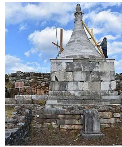
Το ταφικό μνημείο