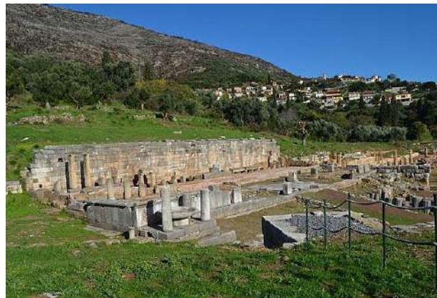
Η κρήνη Αρσιώνη